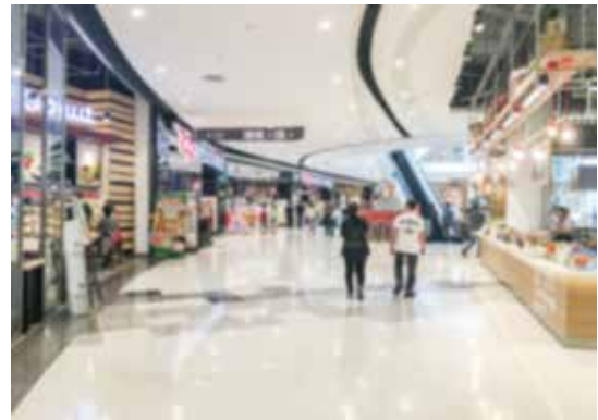
○ショッピングセンターで